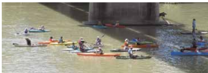
長沼地区の皆さん（新町橋下）