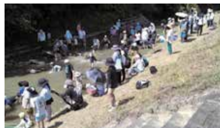
魚つかみをする子どもたち

会場の川には400匹のニジマスが放され、5年ぶりとなった魚つかみ大会は子供たちの魚を捕まえようとする歓声でにぎわっていました。