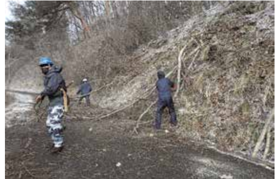
支障木を伐採する活性化推進委員

予算に限りがあり行き届かないところがありますが、精一杯活性化推進委員が実施しています。