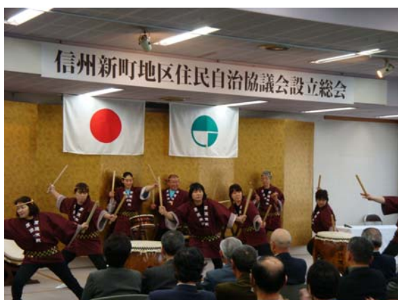
犀流太鼓のアトラクション

商工会、観光協会、社会部長、特別清掃地区環境推進会、農村女性ネットワーク、消費者グループの会、農作物等有害鳥獣捕獲協議会、農家組合長会、人材活用センター、特定非営利法人ふるさと、特定非営利法人くめじ、学識経験者、公募委員