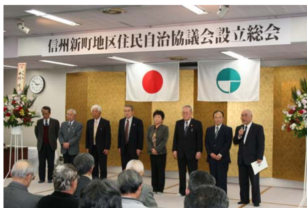
整列してあいさつする役員一同

信州新町地区では住民自治協議会の設立に向け、合併後の新しい組織として昨年 6 月に設立準備会を設置して協議してきました。信州新町の特長、地域資源を活かしながら、住民の自主的な地域づくりと、お互いに支え合う福祉の地域づくりにより、信州新町地区を代表する自治組織を目指していきます。誇りと希望を持てる信州新町の実現に向けて、皆様のご協力をお願いいたします。