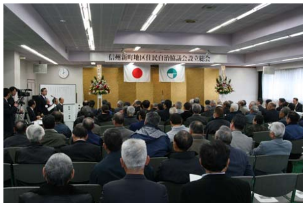
設立総会の会場風景

平成 22 年 2 月 27 日、住民自治の新たなかたちとして「信州新町地区住民自治協議会」の設立総会が開催されました。約 150 人の住民の皆様にご参加いただき、会則、役員、事業計画及び予算などについて承認されました。今後、「地域のことは地域で解決する。」という理念のもと、様々な取り組みを行っていきますので、皆様のご理解とご協力をお願いいたします。