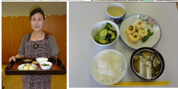
食生活改善推進員のみなさん