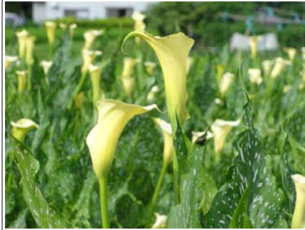
満開のふれあい公園のカラー