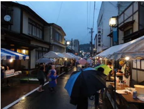
雨にも負けずに夜店に並ぶ子供たち

7月15(木)〜17日(土)に行われた夜店会ですが、雨の中たくさんの方で賑わいました。