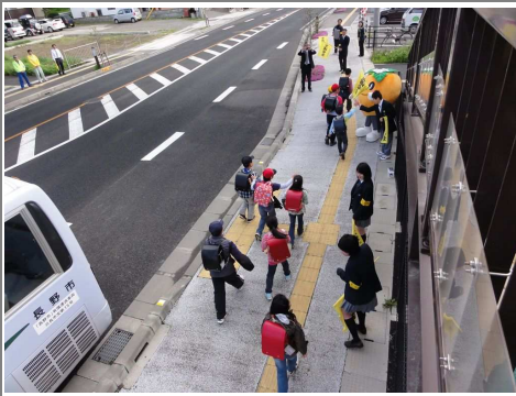
犀峽高校生徒会と「さいきょん」も協力

●安協特別街頭指導 4月22日 交通事故死亡者多発により、特別街頭指導と春の全国交通安全運動街頭指導を実施しました。