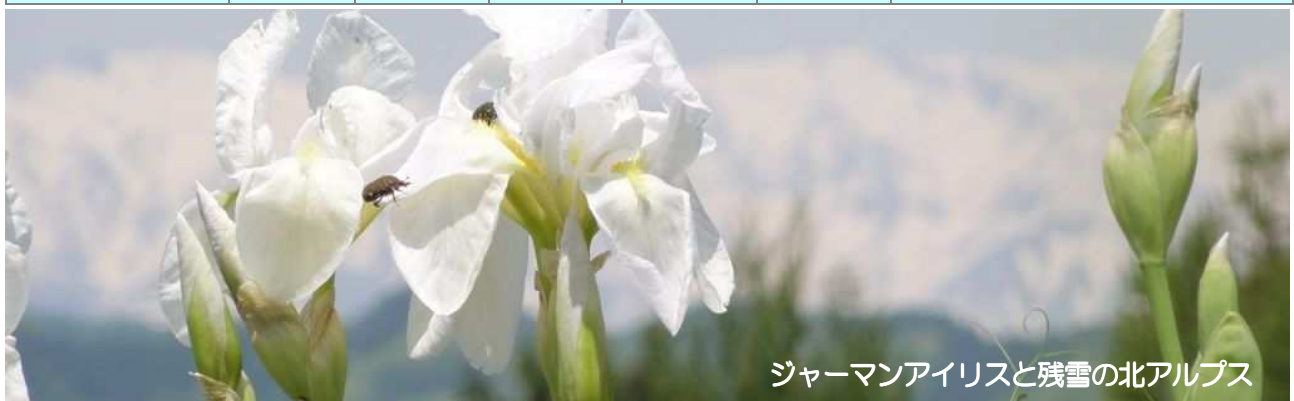
ジャーマンアイリスと残雪の北アルプス