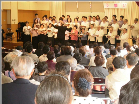
混声合唱団コール ボランとしらゆり会のメンバー

●春季グートボール大会 4月22日 満開の桜の中、グラウンドは選手の方々の熱気で一杯でした。