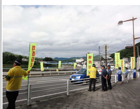
●夏の交通安全やまびこ運動 街頭指導 7月21日 県下一斉の交通安全運動期間中、奈津女橋で街頭指導が行われました。