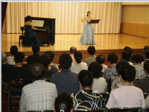
●夏ハートフルコンサート 7月17日 コン・ブリオ信州新町主催でコンサートが開催されました。