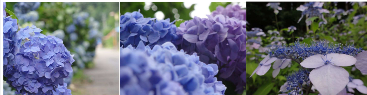
●信級(川名)あじさい街道 県道沿いに咲き誇っていてとても綺麗でした。