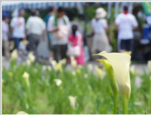
●カラー花まつり 7月9・10日 地場産業センター、さきり荘で開催され大勢の方で賑わいました。