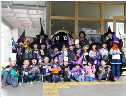
園児も衣装もすごくキュート！ 魔女役の先生が一番楽しそう？

● 保育園ハロウィンで仮装 10月31日に、制作した衣装で仮装した園児たちは、市支所や農協などを訪れ、「ご馳走くれないといたずらするよ」と可愛く唱えていました。