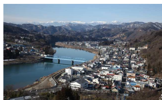
推薦 信州新町からアルプスを望む