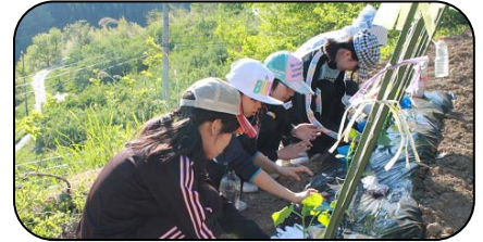
初めての農業体験