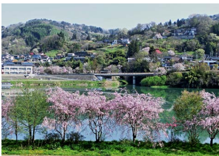
推薦 「ろうかく湖周の春」