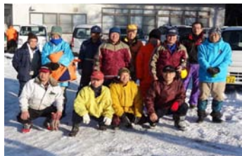
南部区で勢子追いに参加した住民の皆さん

●イノシシ・ニホンジカ勢子 猟友会と地域ぐるみで行う勢子 猟が、今年度は6地区6回実施予 定です。 南部1月12日 越道1月26日 西部2月2日 東部2月16日 竹房2月23日 水内3月2日