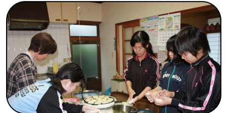
宿泊するお宅でおやきづくり