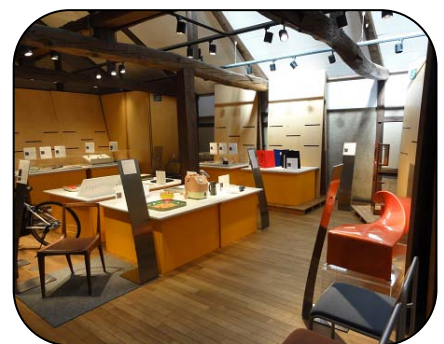
多くの工業製品が展示されているミュゼ蔵

JIDAでは定期的に2,000点余のコレクションの中からピックアップした企画展を開催しています。身近な工業製品のデザインの狙いや作者の思いなどが伝わる解説付きの展示で楽しめますので、足を運んでみてはいかがでしょうか。入場は無料です。