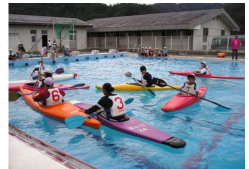
犀峡校カヌー教室

信州新町カヌークラブと犀峡校カヌー部が協働して小・中学生を対象にカヌー教室を開催する計画です。豊かな自然資源である犀川の魅力と、地域の特色あるスポーツであるカヌーの魅力を一体化させ、魅力あるまちづくりやスポーツ文化振興につなげていきたいと考えています。詳細な内容は、事業が採択された後、住自協だよりや告知放送などでお知らせしてまいります。