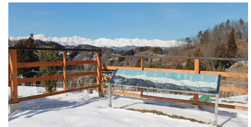
北アルプス展望台

26年度も引き続いた内容の事業や他地区との連携などを視野に入れて実施していきたいと考えています。事業の内容は、採択された後に住自協だよりや告知放送などでお知らせしてまいります。