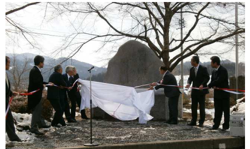
記念碑には校訓「至誠」「努力」「協働」が刻まれています。