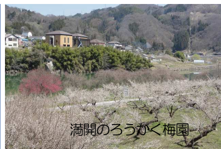
満開のろうかく梅園