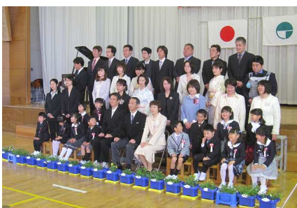
ピカピカの一年生です。 よろしくお祈りします

●中学校入学式 4月4日 今年は、20名の新入生が入学しました。 中学生として、新たな期待と希望に満ち溢れた入学式になりました。