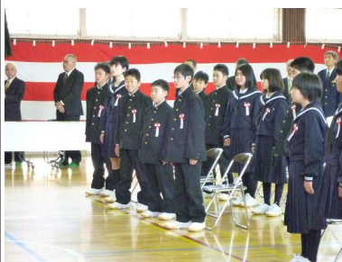
真新しい制服で緊張気味の新入生

●住自協カレンダーが完成 平成25年度のカレンダーが完成しましたので、ご利用ください。 掲載した写真は、「信州新町写真友会」の皆様からご提供していただきました。