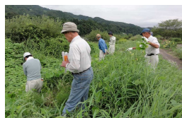
「アレチウリ対策講習会」