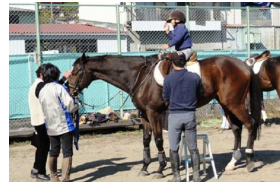
スポーツ健康まつり 「乗馬体験」