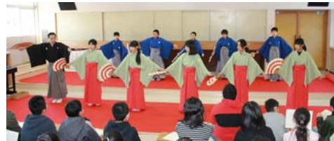
装束をつけて稽古をする小学生

今後も能楽について学ぶ場を提供し、地域の能楽の伝統を継承していってもらう人材の育成に努めていきたいと願っています。