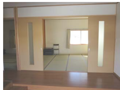
～土間から畳の部屋に～