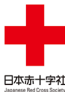
日本赤十字社 Japanese Red Cross Society

皆さんからお寄せいただいた日 赤社資は、災害時の救援救護活動 のほか、地区で実施する日常で役 立つ赤十字講習会(救急法・家庭 看護等)や赤十字奉仕団の育成、 にこにこ赤十字健康教室に使われ ています。