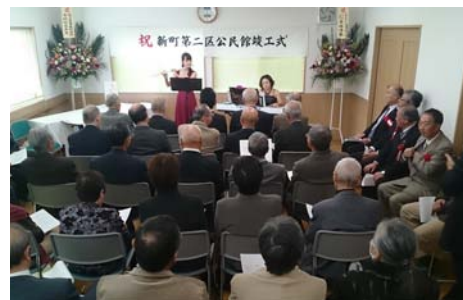
～竣工記念演奏会の様子～