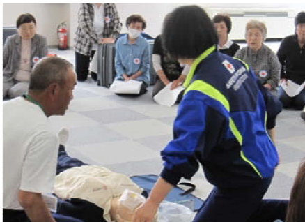
「救急法講習会」の様子