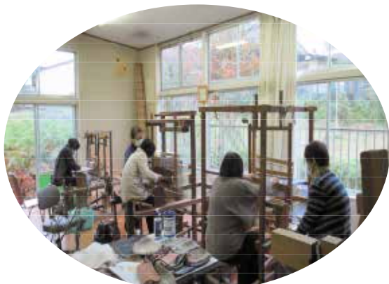
機織り体験会の様子

これからも作品作りに励み、郷土の誇りとして町内外の皆様や子ども達に体験を味わっていただけるよう努力して参ります。