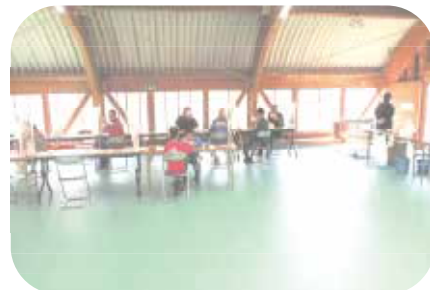
きのこ汁ふるまいブース