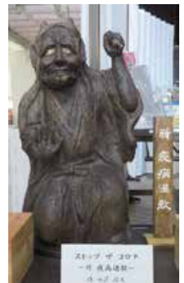
ストップ ザ コロナ ～疫病退散～ 西澤 治夫 氏 作