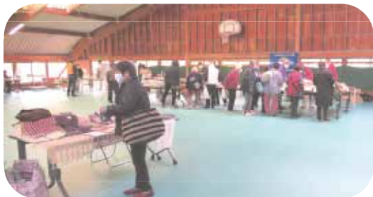
手前 ておりの会 販売ブース 奥 ライオンズクラブ販売ブース