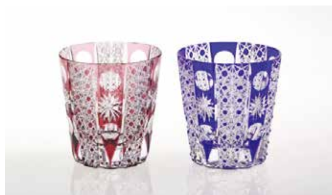
ペアロックグラス