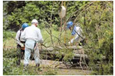
支障木伐採作業の様子

昔それぞれの集落には若者が多く集落間の道の草刈りや支障木の伐採などを行い、作業の終わりには一杯やって交流を深めていましたが、今や65歳以上の高齢者が5割を超え、特に山間地域では高齢化が進み集落間の共同作業ができない状況です。こうした現状を支援するため、平成24年度から「やまざと支援事業」を活用し、区長からの要望をいただき、住民自治協議会活性化推進員を中心に西部土木事務所と草刈りや支障木の伐採個所の調整を図り地域の要望に沿った事業を実施しています。